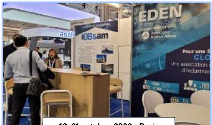
18-21 octobre 2022 - Paris