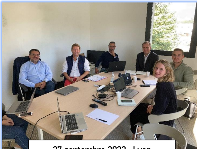
27 septembre 2022 - Lyon