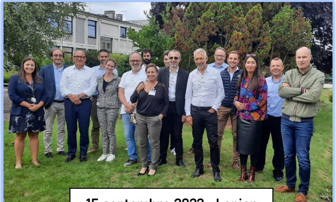
15 septembre 2022 - Lanion