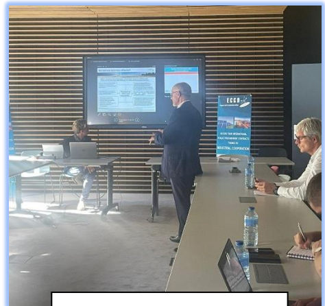
5 octobre 2022 - Lyon