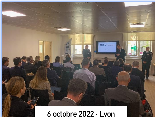
6 octobre 2022 - Lyon